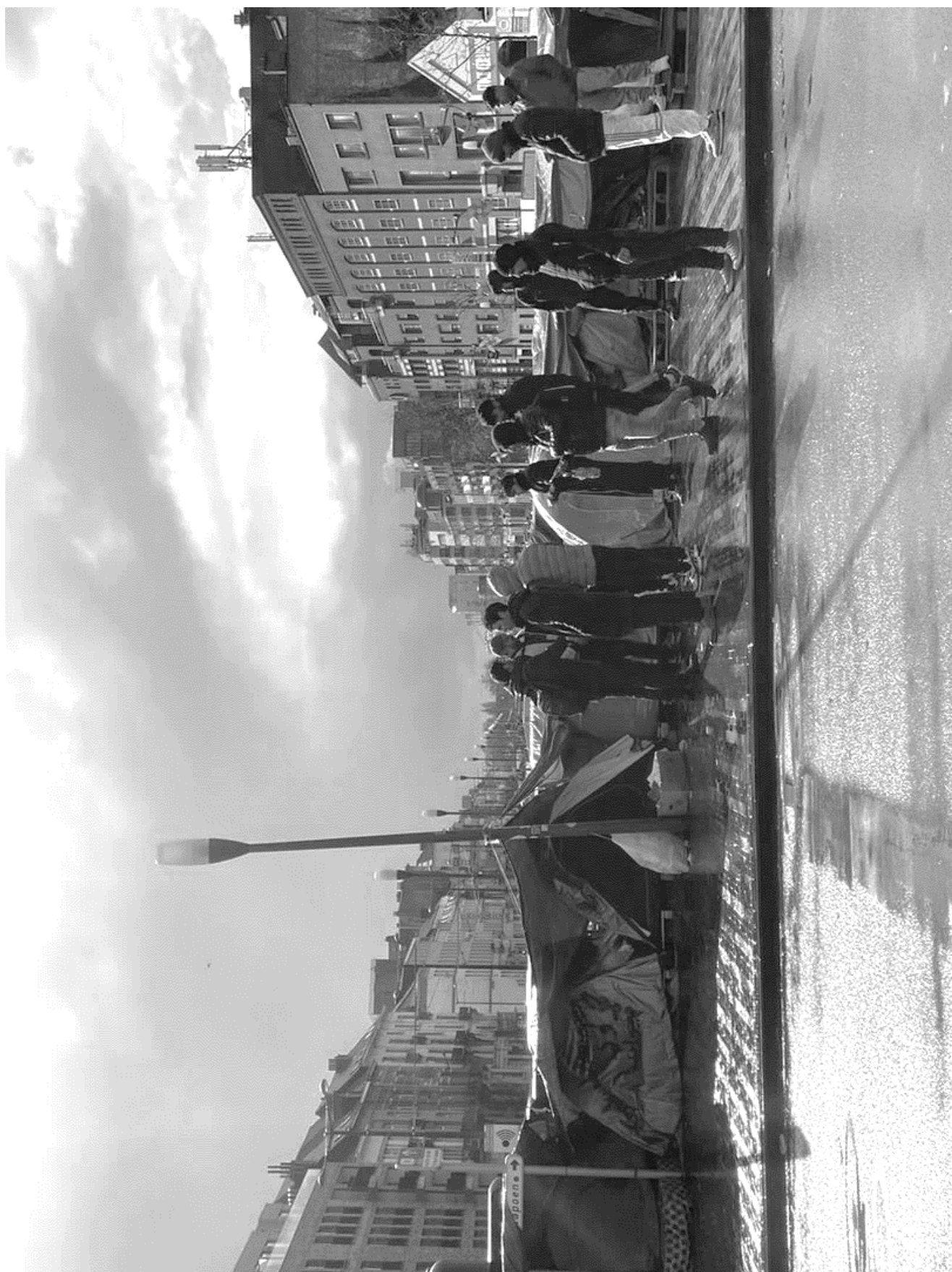
BRIDGE STORIES