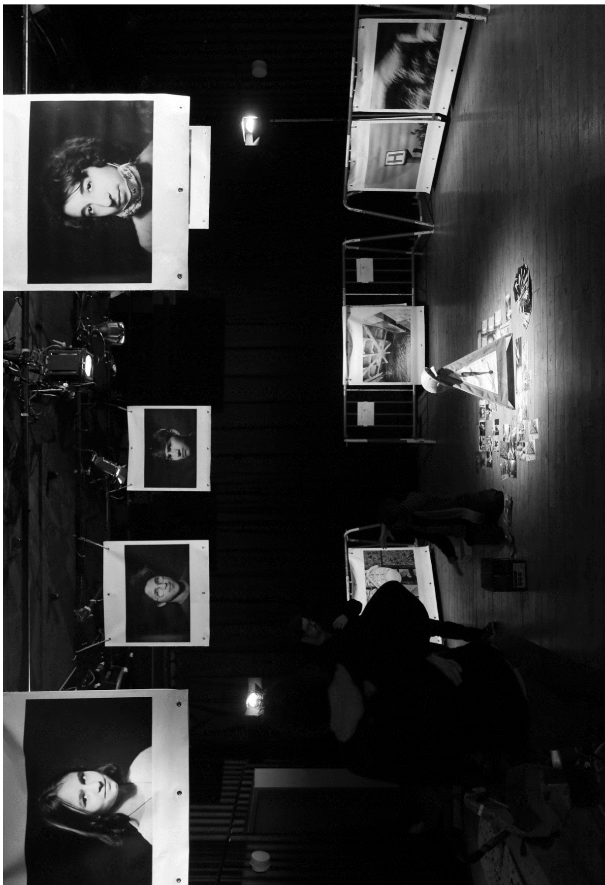
URBE URBANISME EMOTIONNEL