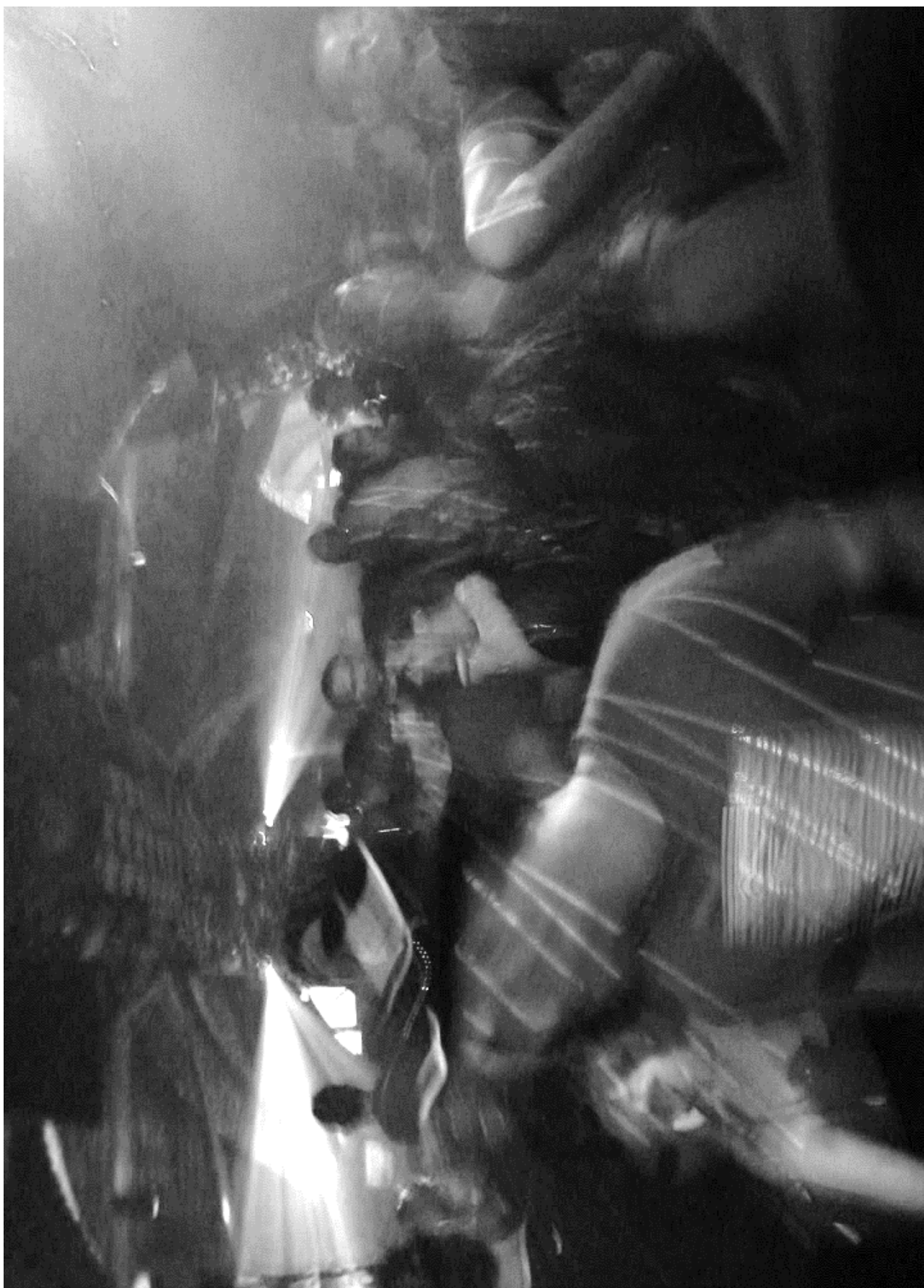
MIND THE NIGHT: LES NUITS DE DEMAIN