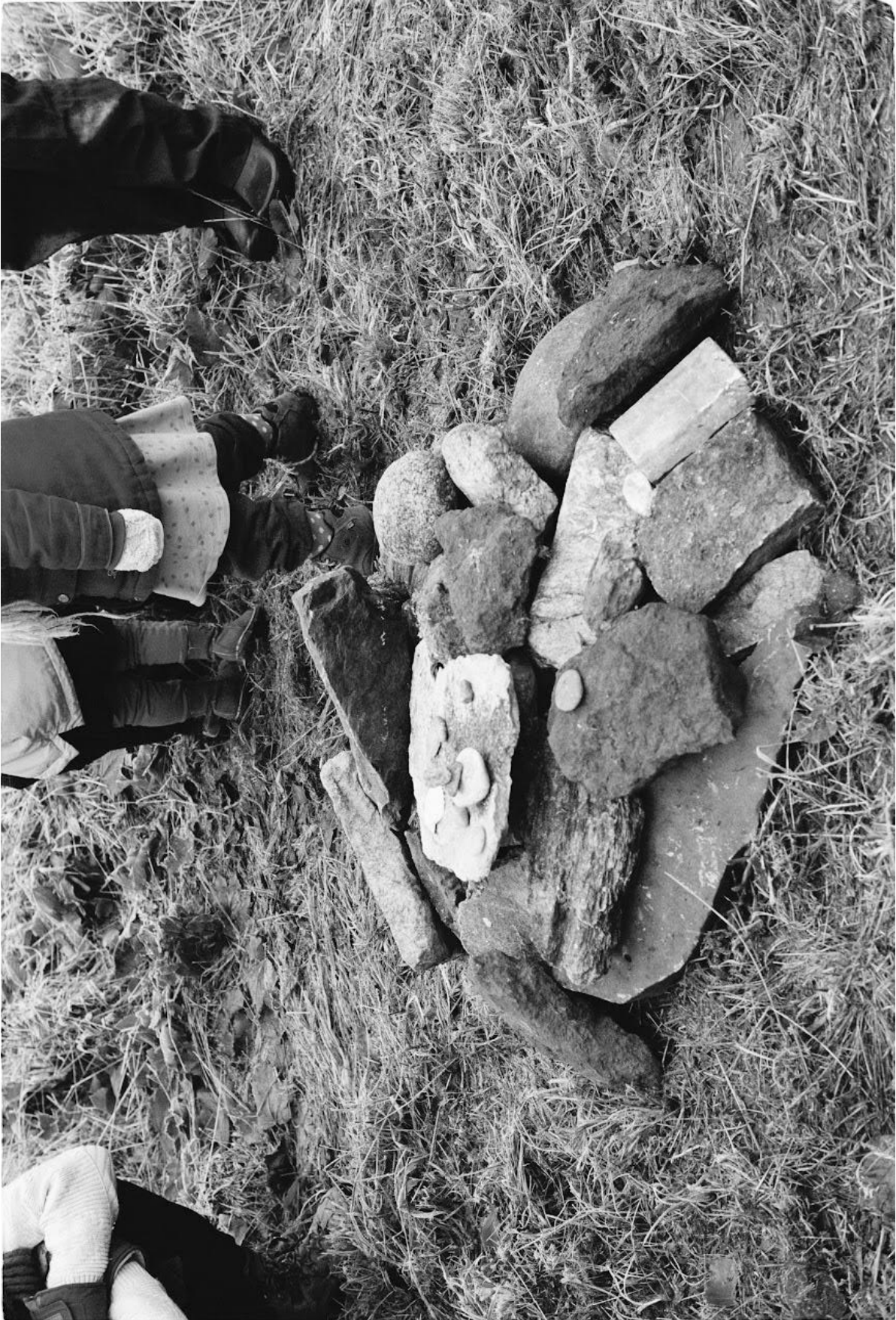
GRIEF IN THE CITY