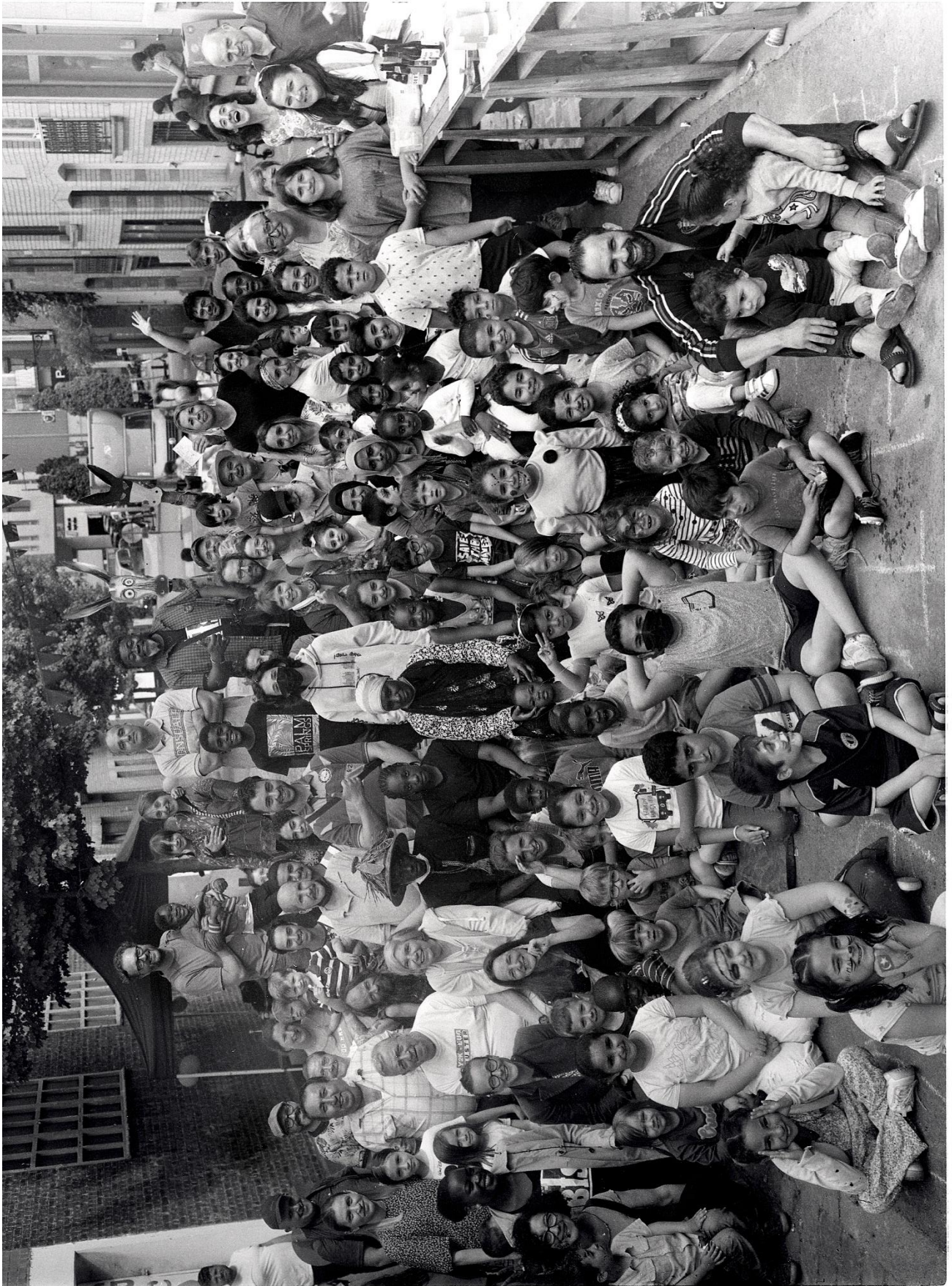
ARPENTAGE D'UN QUARTIER POPULAIRE