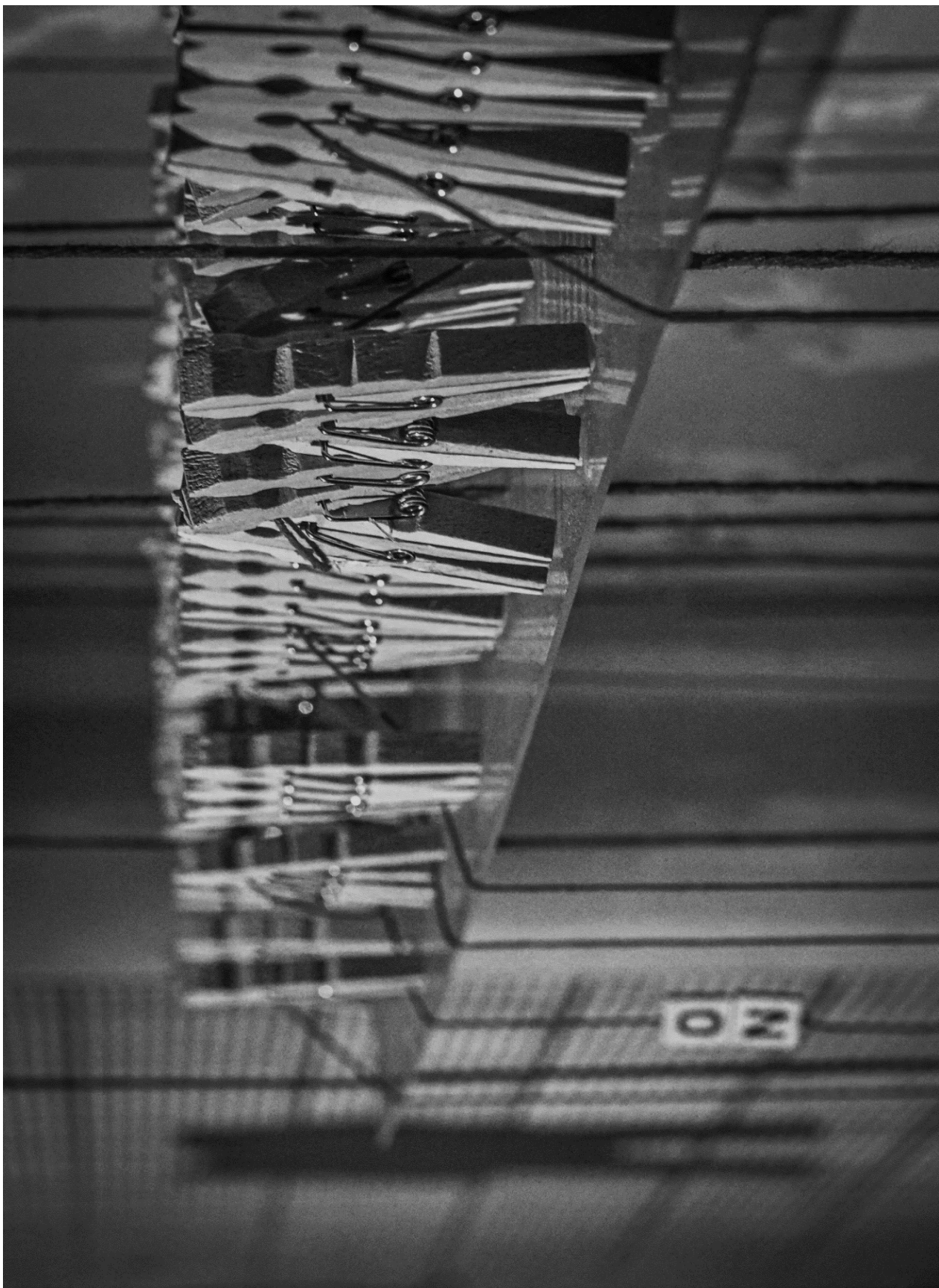
JUS SANGUINIS