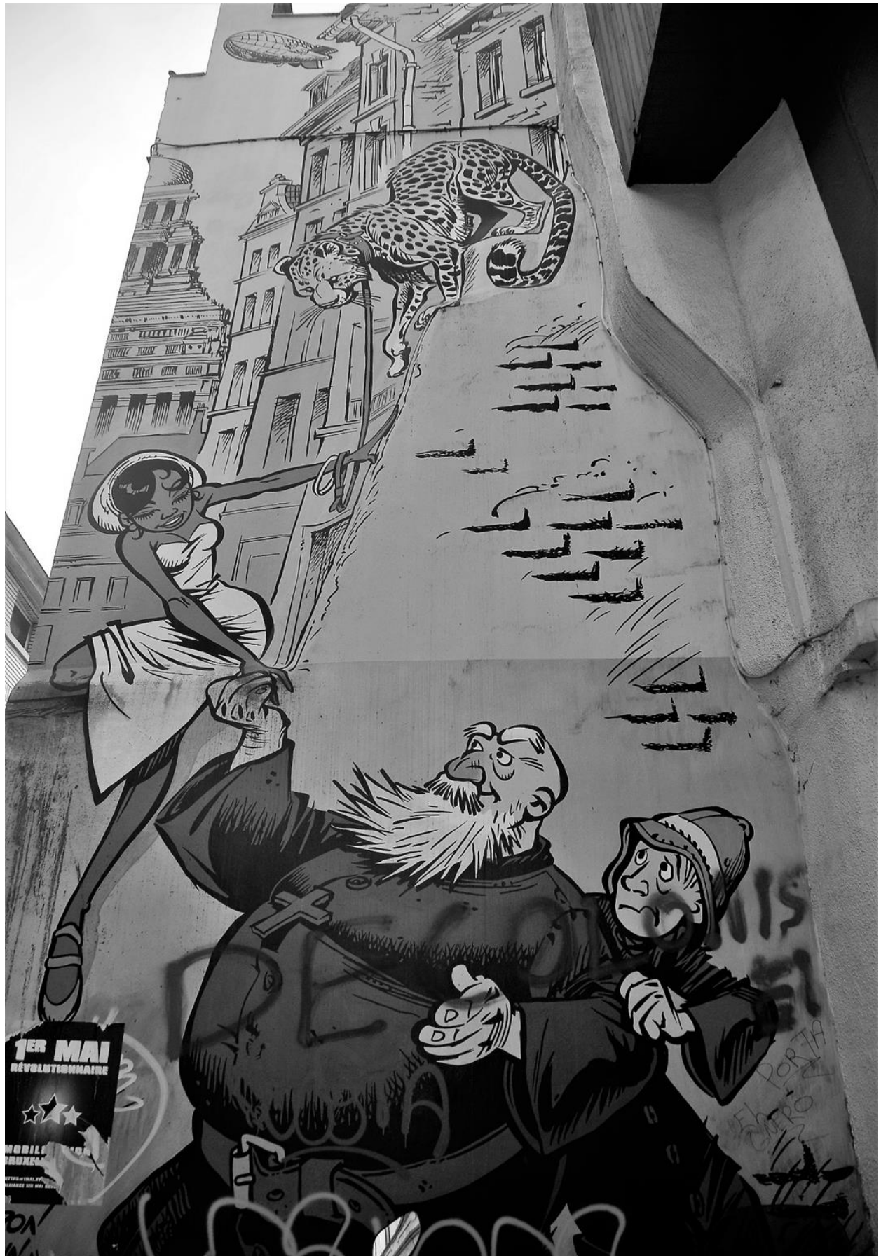
CONTESTED SYMBOLS IN PUBLIC SPACE