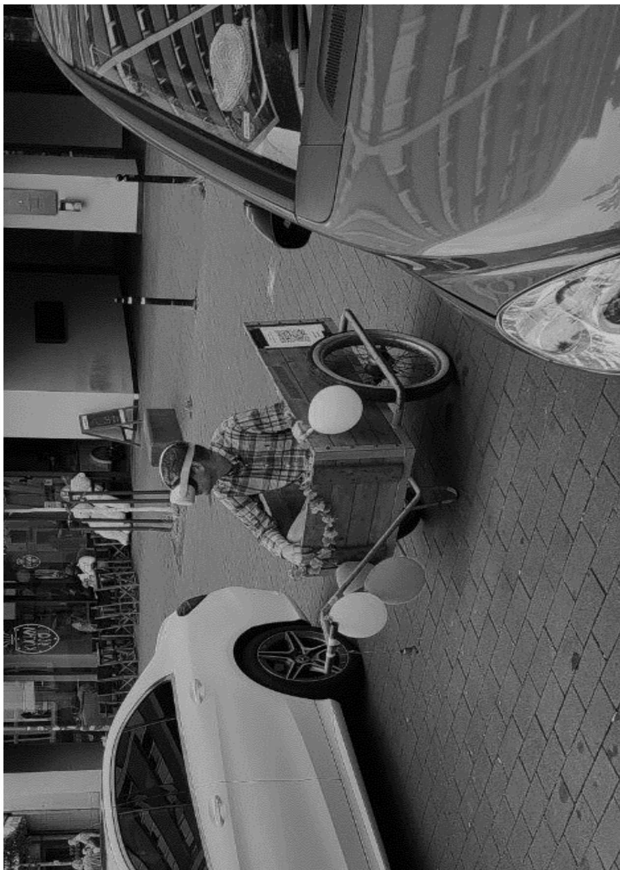
1984 IS NOW